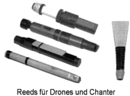
Reeds für Drones und Chanter

Durch Verschieben der Oberteile ( Auf bzw. Ab ) auf dem Tuning Slide werden die einzelnen Drones gestimmt.(Tunen) Drone zusammenschieben - Ton wird höher. Drone auseinander ziehen - Ton wird tiefer. Generell gilt also: je länger die Luftsäule in der Drone wird, um so tiefer wird der Ton. Diese Grundregel gilt für das gesamte Stimmen ( Tuning ) einer Pipe.